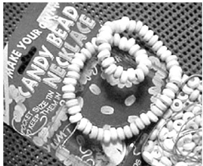
Pendientes hechos de caramelos en forma de pastilla se sirven para esconder MDMA.

Muchos jóvenes reventoneros usan ropa llamativa y portan accesorios que suelen asociarse con el consumo de drogas de club y la cultura del reventón. Esos jóvenes se visten para estar cómodos. Por lo general llevan prendas de vestir ligeras y sueltas. También se visten por capas para poder ir quitándose la ropa poco a poco según se van acalorando por las horas de baile. Muchos chicos usan calzones cortos sueltos o pantalones largos muy amplios y de pierna ancha. La mayoría de las chicas llevan camisetas, sostenes de bikini, corpiños cortos, tops elastizados, y blusas cortas sin espalda para mantenerse frescas. Luego de horas y horas de baile y con el consumo de MDMA—que eleva la temperatura corporal—muchos reventoneros terminan despojándose de la mayor parte de la ropa. Algunos aficionados a los reventones, sobre todo las mujeres,