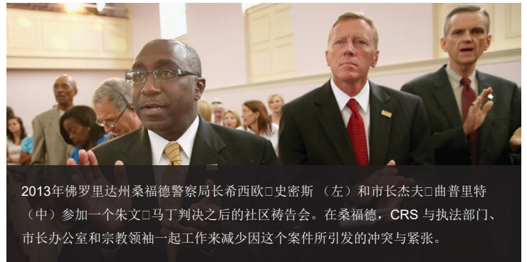
2013年佛罗里达州桑福德警察局长希西欧·史密斯（左）和市长杰夫·曲普里特（中）参加一个朱文·马丁判决之后的社区祷告会。在桑福德，CRS 与执法部门、市长办公室和宗教领袖一起工作来减少因这个案件所引发的冲突与紧张。

CRS 提供对公共活动计划组织者的应急计划和活动司仪培训，如示威和游行活动。CRS 与地方执法部门、活动策划者、社区组织和其他利益相关者合