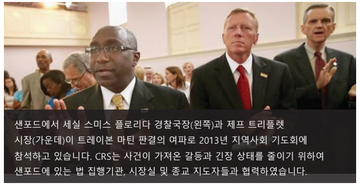
샌포드에서 세실 스미스 플로리다 경찰국장(왼쪽)과 제프 트리플렛 시장(가운데)이 트레이본 마틴 판결의 여파로 2013년 지역사회 기도회에 참석하고 있습니다. CRS는 사건이 가져온 갈등과 긴장 상태를 줄이기 위하여 샌포드에 있는 법 집행기관, 시장실 및 종교 지도자들과 협력하였습니다.

CRS는 시위 및 행진 같은 공공행사를 준비하는 주최자들에게 비상사태계획 및 행사 진행요원 교육을 제공합니다.