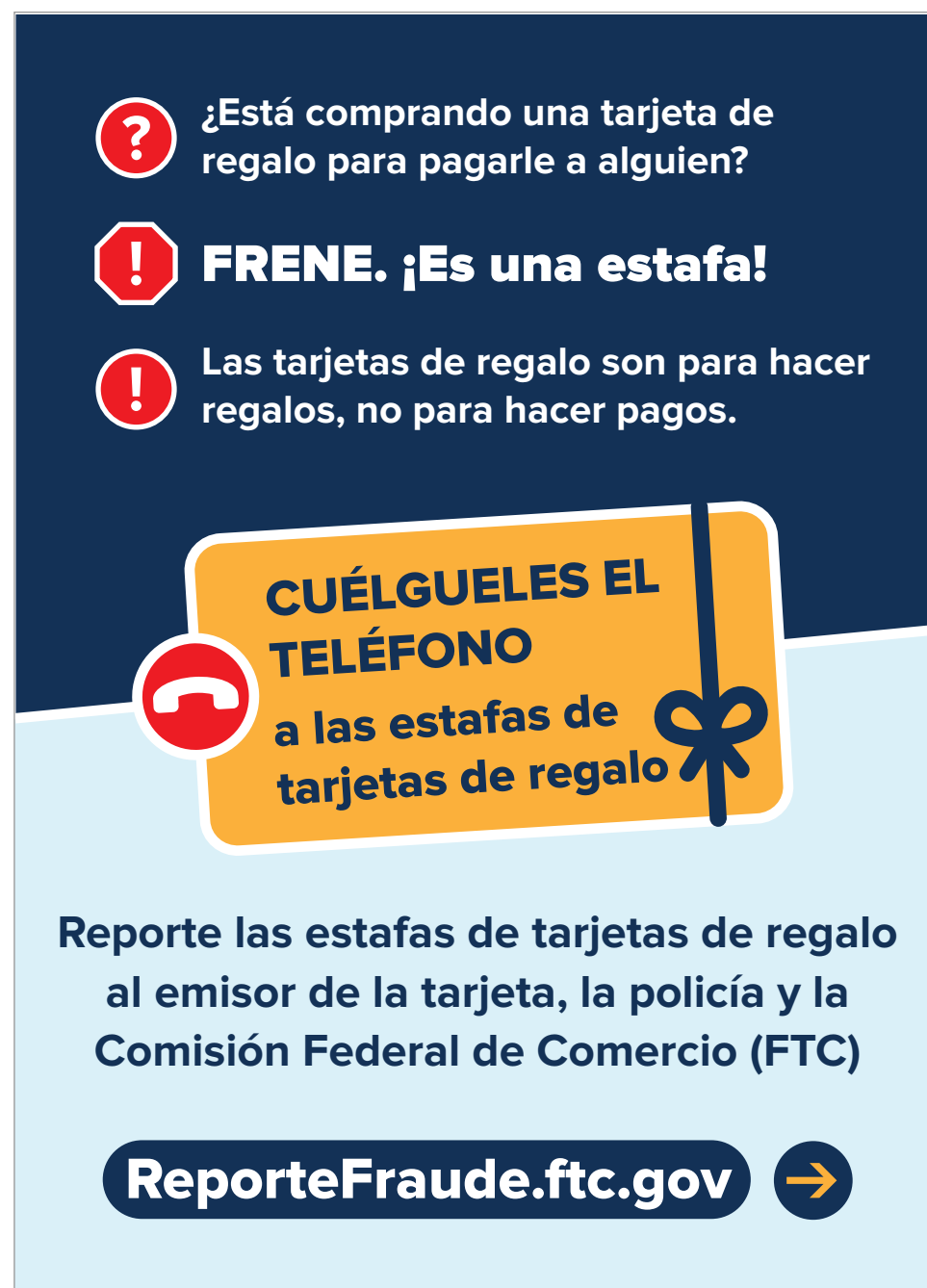
Back option 1